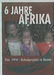
Das Logo zum Schulprojekt in Benin