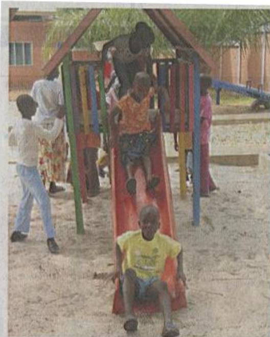
Auch das machen Spenden möglich: Spielplatz direkt vor der Haustüre. Den müssen die Mädchen und Jungen selbst sauber halten.