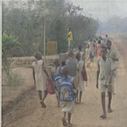
Der Schulweg ist oft viele Kilometer lang. Morgens und mittags ziehen lange Kolonnen von Mädchen und Jungen durch den Busch.