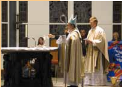
Impressionen der Afrika-Wallfahrt