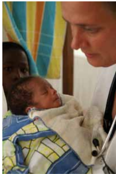
Für Kinder kommt unsere Hilfe oft zu spät

Trotz aller Aufklärungsarbeit werden Kinder häufig erst sehr spät in die Krankenstation gebracht. Die Gründe sind vielfältig. Sie gehen von Nichtwissen über fehlende finanzielle Mittel bis hin zum Glauben an die traditionelle Heilkunst und dem Misstrauen gegenüber der „modernen“ Medizin.