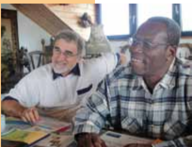
Erzbischof Michel und Monsieur Ludovic, der Ökonom des Erzbistums, erleichtert wegen der großen Unterstützung im Kampf gegen den Hunger