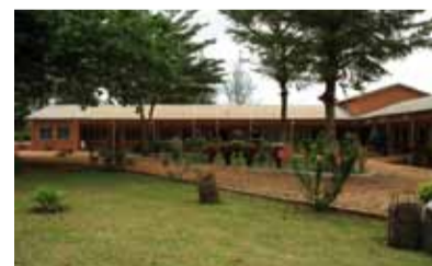
Das Centre Medical Gohomy