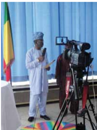
Der Botschafter bei der Begrüßung der Gäste