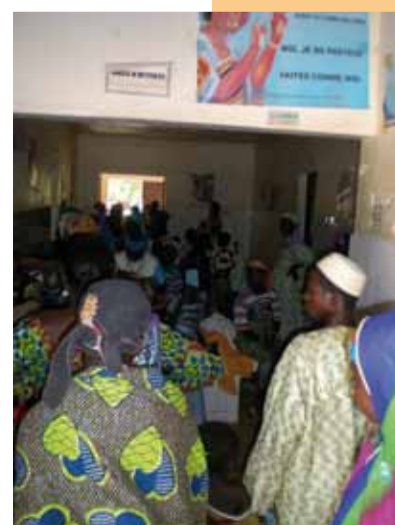
... die tagtäglich von hunderten Menschen mit der Bitte um Hilfe aufgesucht wird