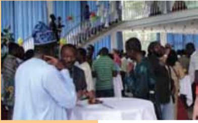
Die Beniner versammeln sich in Berlin zum 50-jährigen Bestehen ihrer Republik