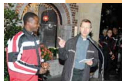
... ein strahlender Generalvikar, der seinen Spitznamen bekam: „Monsignore Honda“