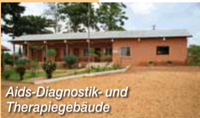
Aids-Diagnostik- und Therapiegebäude