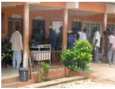
Frühmorgens in der Krankenstation