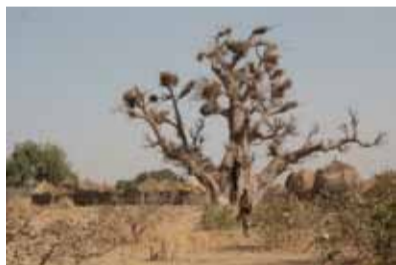
Wie verloren zwischen Hunger, Durst und Sand – und doch voller Würde

Es ist in der heutigen Zeit eigentlich eine Blamage für die Weltgemeinschaft, dass wir überhaupt den Hunger von Millionen Menschen stillen müssen. Heute, wo uns wissenschaftlich und technisch fast alles möglich erscheint. Es beweist mangelndes Interesse und Gleichgültigkeit.