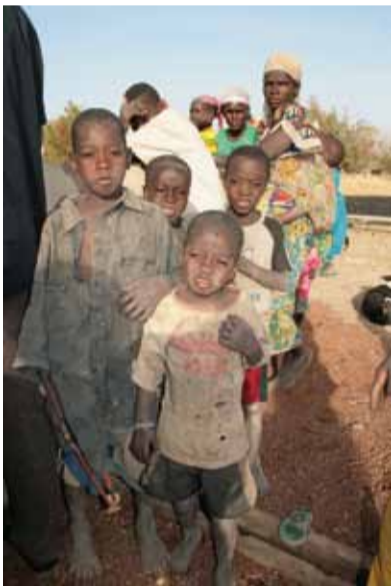
Kinder... in der Dürre Afrikas, vom Staub gezeichnet