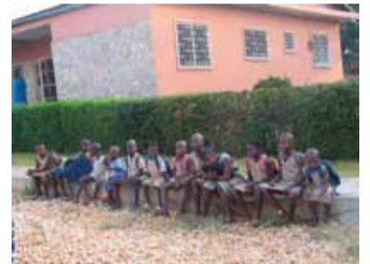
Hilfe, die Perspektive ermöglicht

Im Frühjahr 2011 – nach den Präsidentschaftswahlen in Benin, also voraussichtlich in der letzten Märzwoche – wird APH eine einwöchige Spenderreise nach Benin durchführen. Sie wurde zuletzt zum Richtfest der Krankenstation in Gohomey vor 15 Jahren unternommen.