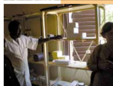
Die desolaten Krankenstation in Makalondi ...