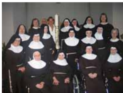
Die Wallfahrtskerze von den Klarissen-Schwestern gefertigt