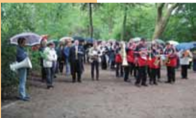
Wallfahrt für Afrika mit dem Musikverein Kervenheim