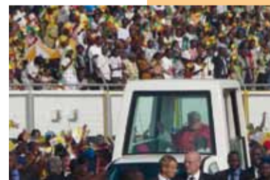
Der Papst fährt im Papamobil ins Stadion ein