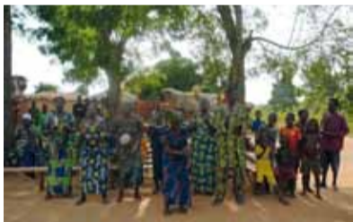
Im Dorf Hagoumey

Nachdem ich – sehr unter Zeitdruck – schnell eine Internetverbindung aufbauen konnte und den ersten Reisebericht einschl. Fotos für unsere facebook-Seite (die von Sebastian Seitz und Ramona Swhajor in Berlin betreut wird) absetzen konnte, knatterten schon die Mopeds: unsere Reisegruppe machte sich auf in die Dörfer. Wir sitzen hier bequem auf den Fahrzeugen, was müssen die afrikanischen Frauen aushalten, die mit schweren Schüsseln oder Holz sich den Weg erlaufen müssen.