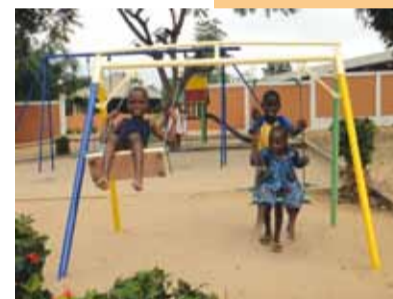
Spielplatz der Waisenkinder