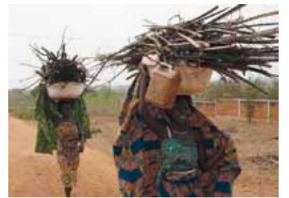
Alltag in Benin