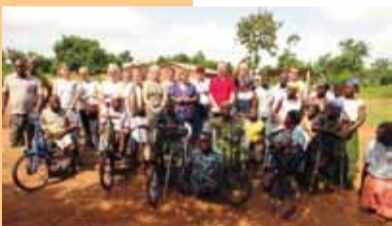
Empfang der APH-Gruppe in Kissamey