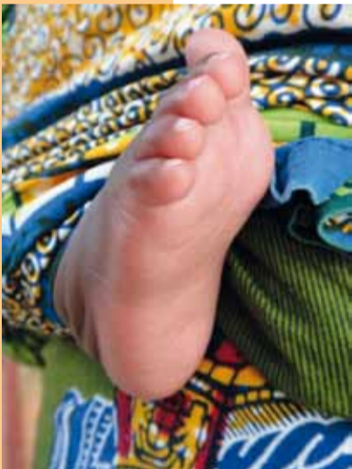
Schützling der Kinderkrippe