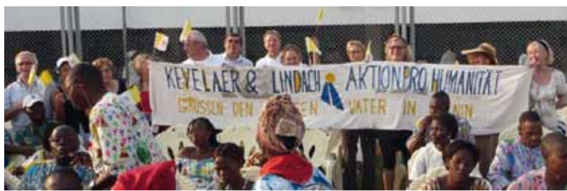
Begrüßung für den Papst

Am Abend gibt es noch viel zu tun. Wir brauchen ein Plakat für den Papst, um ihn zu begrüßen. Isolde Folger und ich werden kreativ. Dabei entsteht aus einem Bettlaken das wunderbare Transparent „KEVELAER und LINDACH mit AKTION pro HUMANITÄT grüßen den Heiligen Vater in Benin“ – schön ist es geworden unser Transparent.