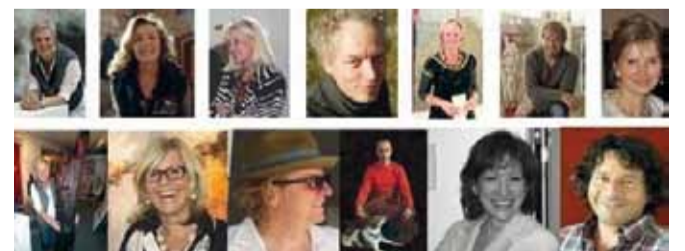
Künstler der Art for africa

Besuchen Sie unsere Website www.pro-humanitaet.de . Die Künstler laden Sie zu dieser wunderbaren Aktion ganz herzlich ein.