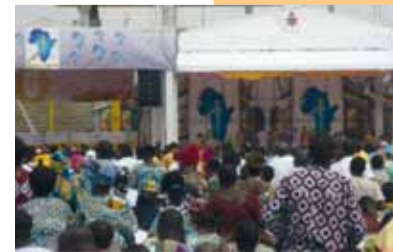
Im Stadion während der Papstmesse