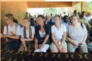
Spender in Kissamey