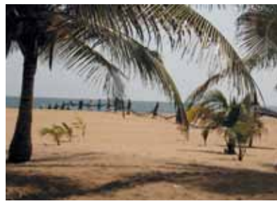
Strand in Quidah