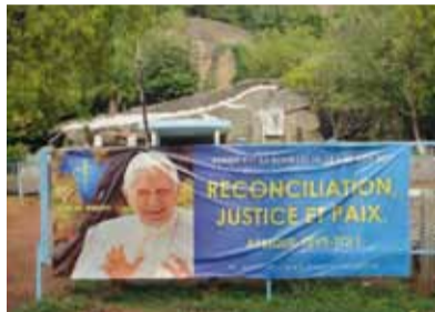
Der Besuch des Papst ist überall gegenwärtig.

freudiger Erwartung: der Papst kommt! Selbst im Fernsehen ist statt des Logos der Fernsehsender das Papstbild eingeblendet. Einer der Plakat-Slogans, die uns entgegen kommen: „ AFRIKA STEH AUF! “ Für die Menschen hier ist es eine überaus große Freude, Ehre und Auszeichnung, dass Papst Benedikt das Land besucht, egal ob Christen, Muslime oder Animisten – über alle Bevölkerungsschichten hinweg geht diese wirklich große Vorfreude und Erwartung. Von den Beninern hört man schon, der Papst solle doch alle 5 Jahre kommen, dann ginge Vieles schneller voran. Wir sind alle ziemlich verwundert und lassen uns auch von dieser Stimmung anstecken.