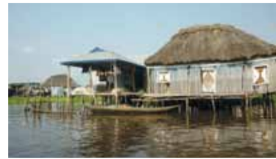
Im Pfahldorf Ganvie

Nach einer Rast macht sich ein Teil unserer Reisegruppe noch auf den Weg nach Ganvie, das Pfahldorf auf der Lagune. Hier „fristen“ 20.000 Menschen ihr Leben und leben unter ärmsten Bedingungen. Sie betreiben Fischzucht und Handel auf schwimmenden Märkten.