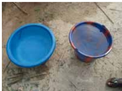
Sauberes, reines Wasser in Makalondy