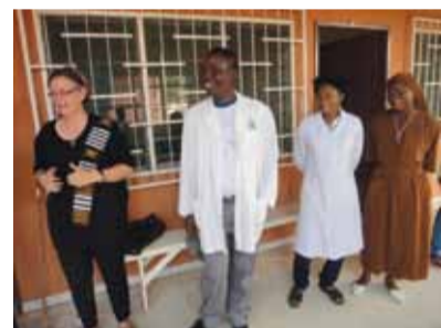
Das neue Ärzteteam

Nach einer Rast macht sich ein Teil unserer Reisegruppe noch auf den Weg nach Ganvie, das Pfahldorf auf der Lagune. Hier „fristen“ 20.000 Menschen ihr Leben und leben unter ärmsten Bedingungen. Sie betreiben Fischzucht und Handel auf schwimmenden Märkten.