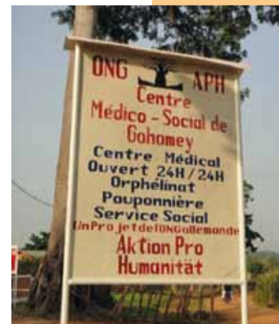
Schild unserer ONG