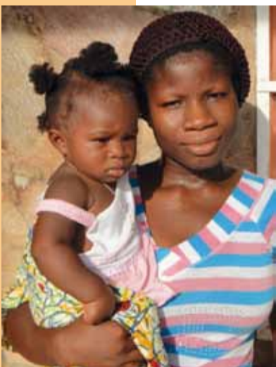
Mutter und Kind der Kinderkrippe