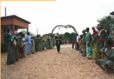
Begrüßung in Gohomey