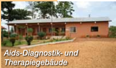
Aids-Diagnostik- und Therapiegebäude