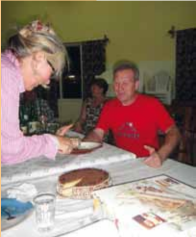
Abendessen im Multifunktionssaal